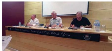
El Consejo Vecinal en el que se tomó la decisión. INFORMACIÓN

Desde Isla de León considera que todas ellas “son competencia” de la Demarcación de Costas de Andalucía Atlántico “porque pertenecen y están dentro del Dominio Pú-