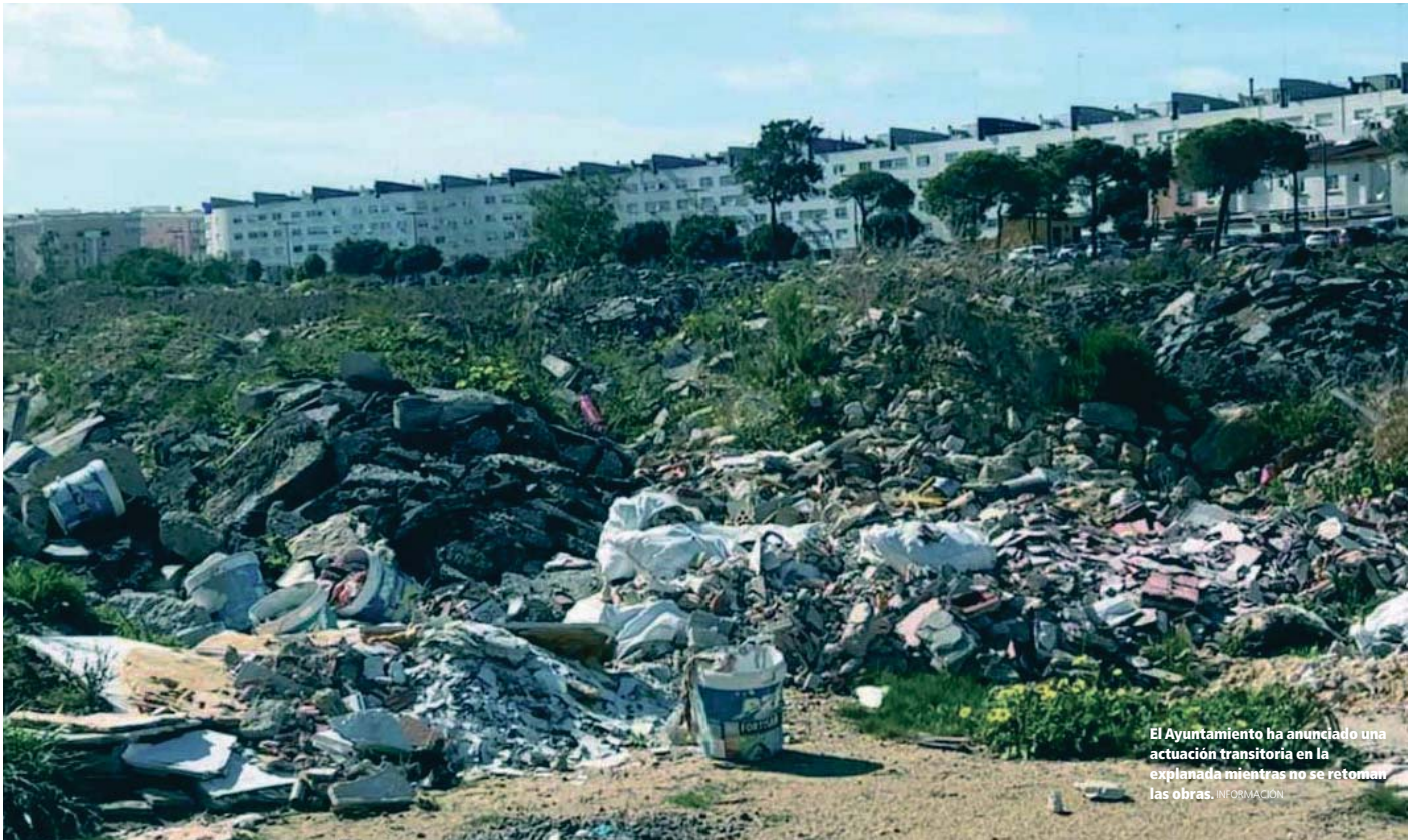
El Ayuntamiento ha anunciado una actuación transitoria en la explanada mientras no se retoman las obras. INFORMACIÓN

URBANISMO EL GOBIERNO LOCAL MARCA DESDE HOY SU NUEVA HOJA DE RUTA DE LA MAGDALENA TRAS ROMPER CON LA EMPRESA