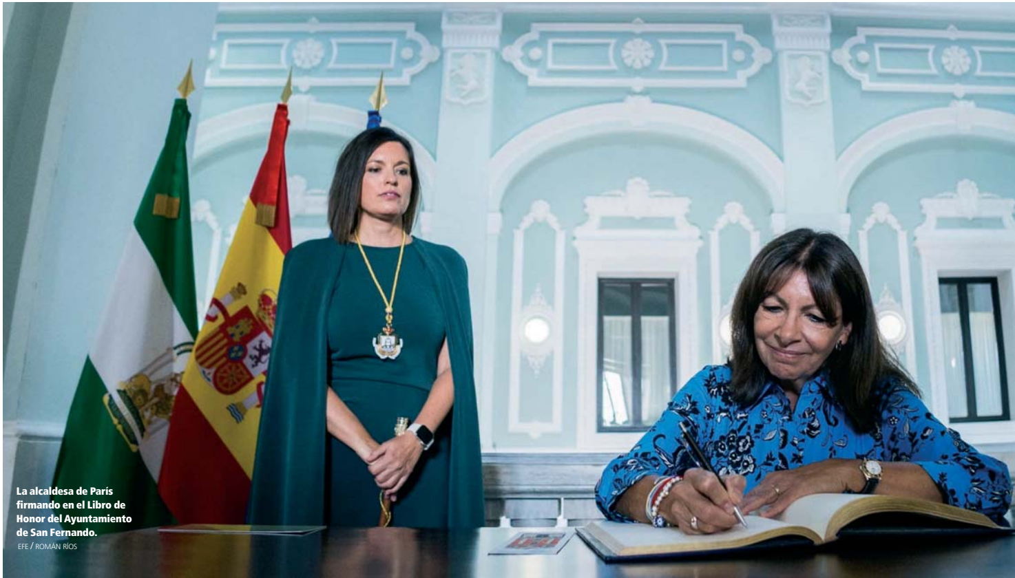
La alcaldesa de París firmando en el Libro de Honor del Ayuntamiento de San Fernando.

INSTITUCIONAL LA ALCALDESA DE PARÍS DE ORIGEN ISLEÑO RECIBIÓ EMOCIONADA EL XIII PREMIO CORTES DE LA REAL ISLA DE LEÓN A