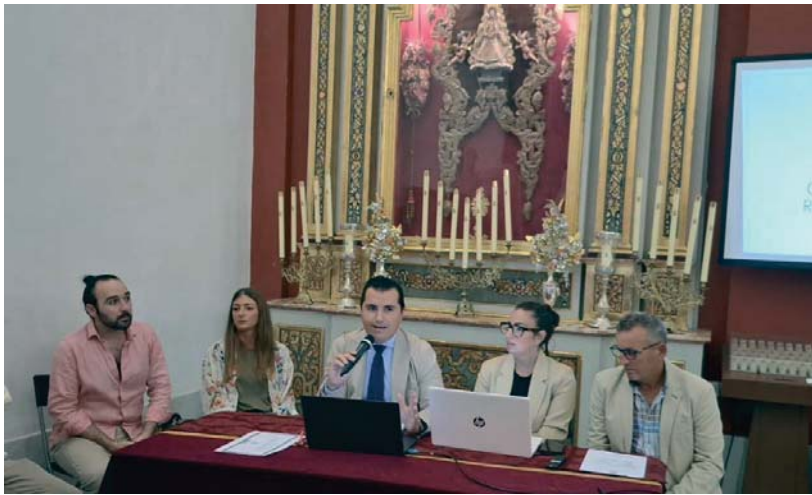
Un momento de la celebración del Cabildo en la parroquia de la Bazán HDAD