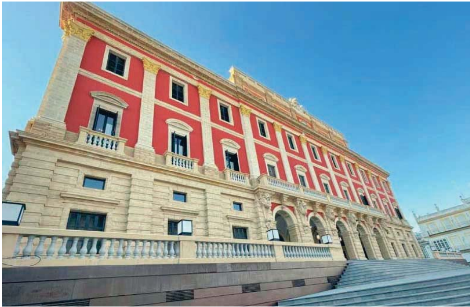
El Presupuesto Municipal de 2024 se ha ejecutado en algo más de un 30% los seis primeros meses del año. INFORMACIÓN