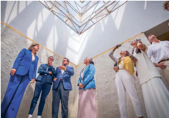
La inauguración de la pabellón temporal 'La Sal' en la céntrica Plaza del Rey.

■ San Fernando se convierte a lo largo del próximo mes en el centro del debate nacional sobre la regeneración de los espacios urbanos