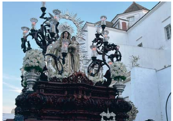
La Virgen de las Mercedes en procesión A.M.

La imagen de las Mercedes se recogía con una plaza repleta de público para verla entrar en la Capilla sobre las once de la noche en otra jornada para el recuerdo.