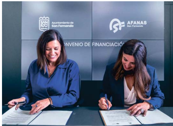
La alcaldesa isleña durante la firma con la gerente de Afanas.