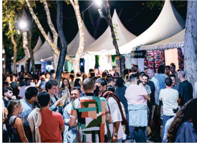
Ambiente en el parque Almirante Lauhé el pasado fin de semana.