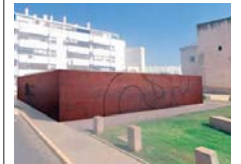
Una infografía. AYUNTAMIENTO