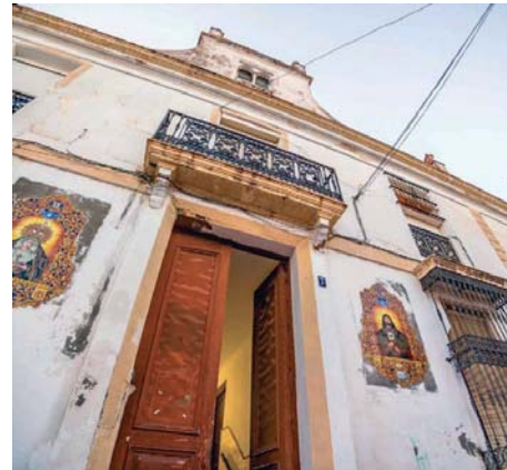
La cesión de la antigua capilla ya es oficial. AYUNTAMIENTO

■ Se convertirá en un espacio cultural y en la sede del Consejo Local de Hermandades y Cofradías