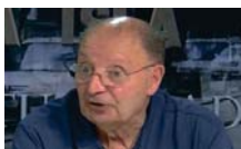
JESÚS HIDALGO PRESIDENTE CH SAN FERNANDO

La alcaldesa de París, Anne Hidalgo, fue distinguida con el XIII Premio Cortes de la Real Isla de León durante la celebración del 24-S. Hidalgo, en su discurso, animó a defender desde los ayuntamientos los valores de la democracia "en unos momentos difíciles en los que están subiendo los populismos".