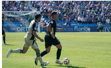
Mala imagen del San Fernando CD en Linarejos.

El Club Deportivo no comparó en los segundos cuarenta y cinco minutos. Los isleños continuaron con la inercia vista tras encajar el gol, y