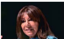
ANNE HIDALGO ALCALDESA DE PARÍS

La alcaldesa de París, Anne Hidalgo, fue distinguida con el XIII Premio Cortes de la Real Isla de León durante la celebración del 24-S. Hidalgo, en su discurso, animó a defender desde los ayuntamientos los valores de la democracia "en unos momentos difíciles en los que están subiendo los populismos".