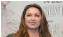
NIÑA PASTORI CANTANTE