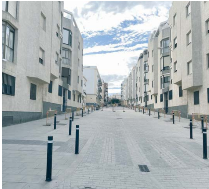
La calle Héroes del Baleares pasará a denominarse próximamente Juan Rivero.

Cabe reseñar que este cambio se enmarca en el cumplimiento de las leyes de memoria histórica y busca homenajear la trayectoria del cañiñal, uno de los autores más im-