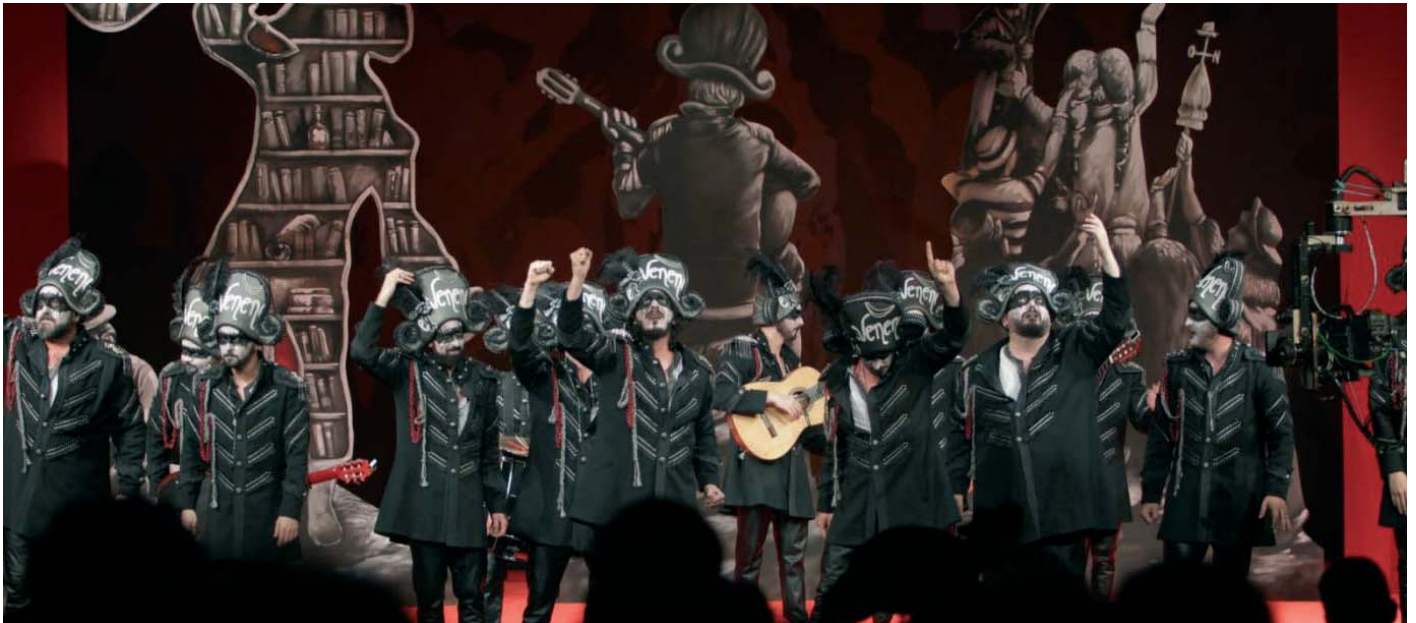
'La Eterna Banda del Capitán Veneno' durante su actuación en un homenaje a Juan Carlos Aragón en el Gran Teatro Falla. A.G.

FIESTAS EL AYUNTAMIENTO ISLEÑO ULTIMA LOS CONTRATOS CON LAS AGRUPACIONES DEL COAC 2025 PARA TRAERLAS A LA CIUDAD