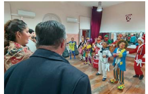
La chirigota infantil isleña 'Los Trataratachin'. INFORMACIÓN

El tiempo máximo de actuación de las agrupaciones será de 30 minutos, que se contabiliza desde el comienzo de la interpretación de la presentación hasta el final del popurri.