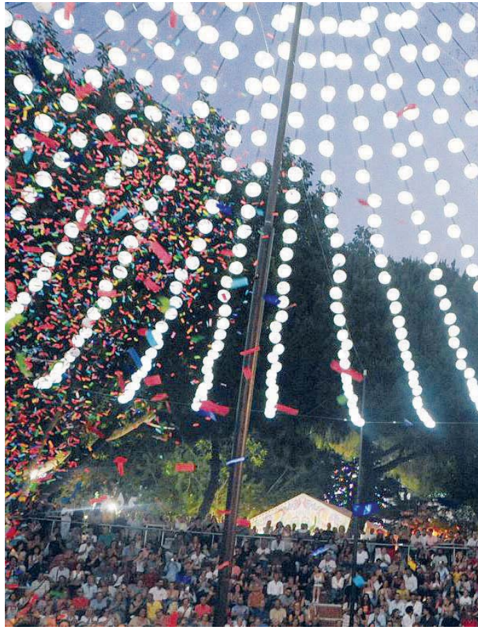
El paraguas central del Parque no faltará en la Feria del Carmen y de la Sal 2025. J.F. CABEZA

torno a unos 15.000 metros de guirnaldas de colores rojos y blanco que se distribuirán entre los pasillos y techos de las casetas, las terrazas de las mismas, la antigua zona de la fuente, zona de arboleda y las calles aledañas al recinto del céntrico espacio verde de la ciudad y el recinto de las atracciones, que de nuevo se