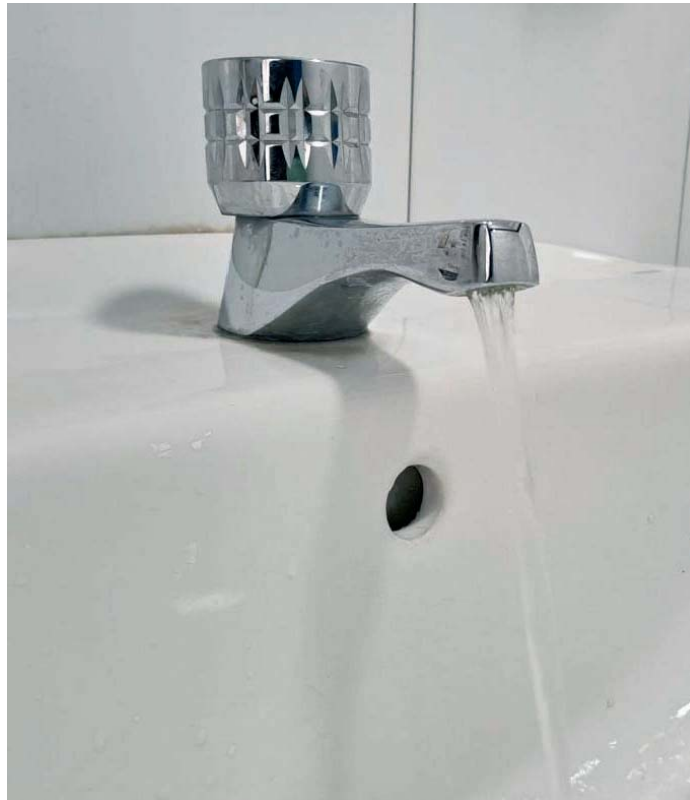
El Gobierno local castigará a los que hagan grandes derroches de agua. INFORMACIÓN