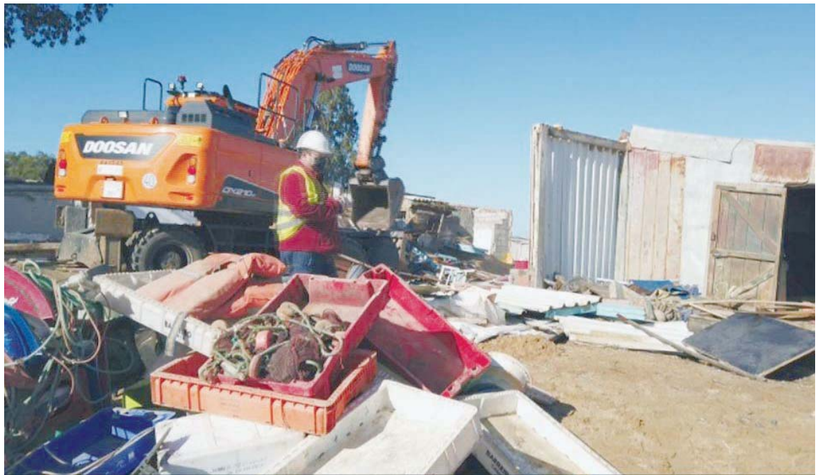
Una imagen de archivo de hace tres años cuando se procedió al derribo de las casetas de la playa de La Casería.

Sobre el litigio que mantienen con Costas para que su negocio siga en la misma ubicación actual, señala que “está todo parado y no sabemos nada”, mientras que añade que “me parece bien que hagan el paseo marítimo, ya que La Casería se merece que la arreglen, pero no hace falta quitar los dos bares que hay aquí. Qué hará la gente cuan-