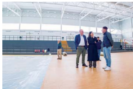
La alcaldesa visitando las obras del pabellón.

La sala disponía de un pavimento de resina epoxi que había cumplido ya su función, por lo que ha procedido a su renovación con un suelo vi-