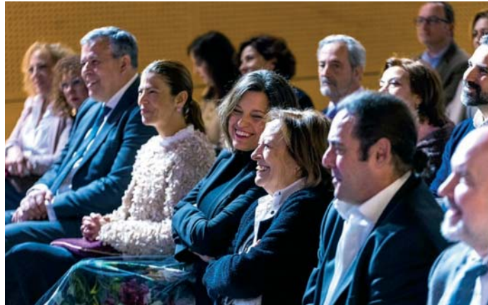
Varios momentos del acto que acogió el Ayuntamiento isleño el pasado sábado.