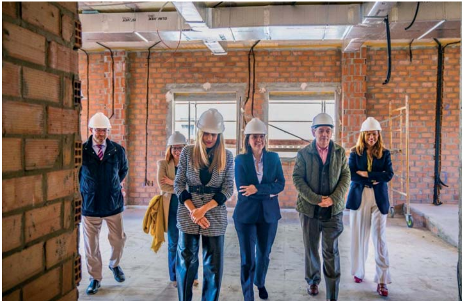
Cavada anunció en la visita al nuevo centro de Parkinson, colindante con el de salud, que el Ayuntamiento asumirá las obras del parking.

SAUD CRECE EL MALESTAR ENTRE EL AYUNTAMIENTO Y LA JUNTA POR ESTA OBRA