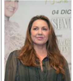
Niña Pastori. INFORMACIÓN