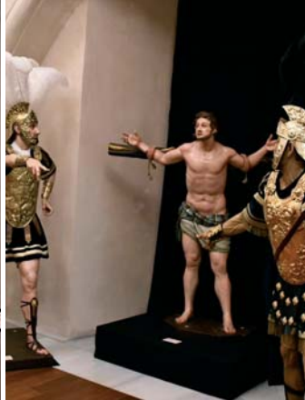
Algunas de las imágenes que podrán encontrarse en esta muestra.