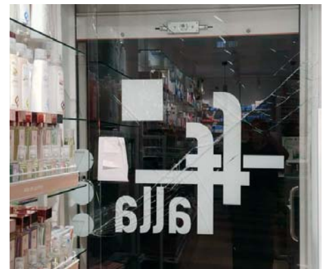
Así quedó el cristal de la puerta de acceso tras la huida. INFORMACIÓN

Cuando emprendió la huida golpeó la puerta del establecimiento provocando la rotura del cristal; al parecer, posteriormente se marchó en bicicleta. Hasta la farmacia se desplazaron agentes de la Policía Nacional para tratar de esclarecer lo sucedido y dar con el autor del atraco, que fue detenido en la misma tarde de los hechos, sin que pudieran localizar el arma utilizada.